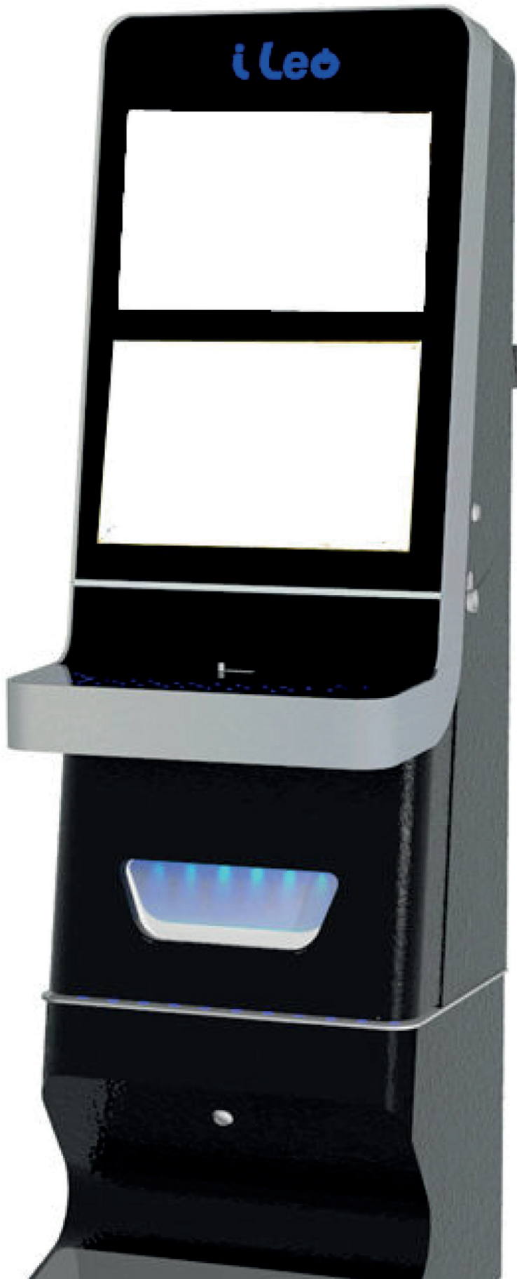
Plancia Pulsanti Opzionale